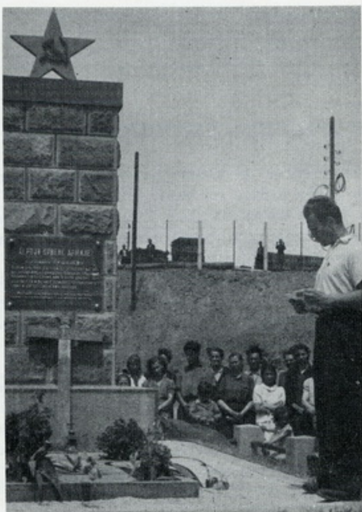
Sa otkrivanja spomenika poručniku Akšajevu

RUDNIKA PODIŽE OVAJ SPOMENIK U ZNAK DUBOKE ZAHVALNOSTI I VEČNOG PRIJATELJSTVA SOVJETSKIH I JUGOSLOVENSKIH NARODA. ISPUNISMO POSLEDNJU ŽELJU POGINULOG HEROJA I SAHRANISMO GA NA OVOM MESTU“ (Spomen ploča čuva se u Muzeju rudarstva i metalurgije – Bor).