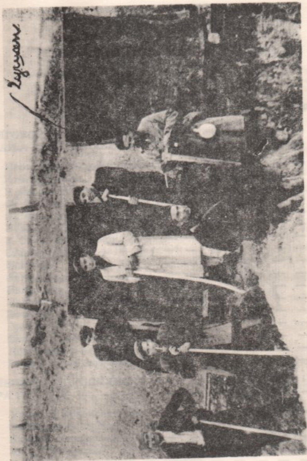
14. Присилни радници на раду у Лазници.