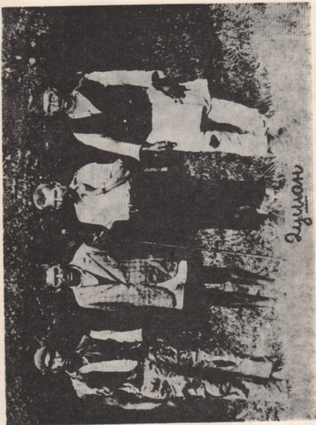
12. Присилни радници у лагеру Вестфалену.