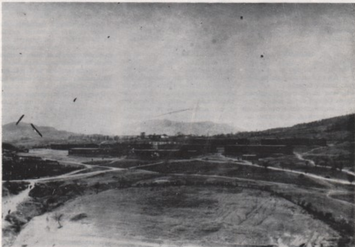
Баракe борског логора