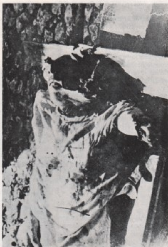
Лешени борбених логораша

сати поподне пробавили на пољу гладни, жедни и промрзли.