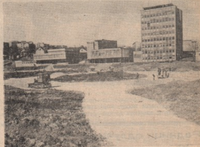
Будући парк у центру града добија своје контуре

станара и наплате терена у складу са расположивим средствима. Напротив, базе за инвестицијам у складу са расположивим средствима. Напротив, базе за инвестицијам у складу са расположивим средствима. Напротив, базе за инвестицијам у складу са расположивим средствима.