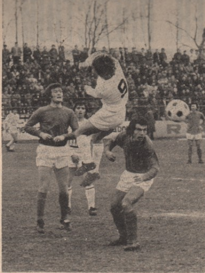
Са утакмице Бор — Раднички — Борфевел и "сендићу"

У недељу борски тим игра у Новом Садлу против Војводина, а 8. априла на свом терену састају се са сплитским Хајдуком. Тренер