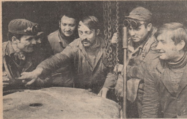
Радници на одржавању механизације Грађевинског предузећа „Бор“

производа. Знатио су већи и трошкови произвођаче граде од максимирале цене квадратног метра изграђене површине.