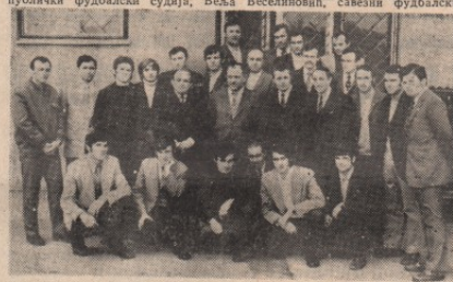
Судије — будући делатоци фудбалске правде