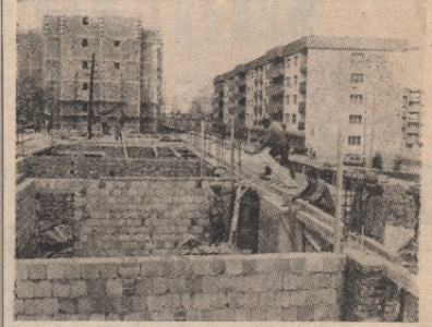
Радници ООУР „Градња“ на послу

Ипак, нису забринути сви радници јер постоји још десетак молби за добијање станова. Потребна за новим становима је присутна, а