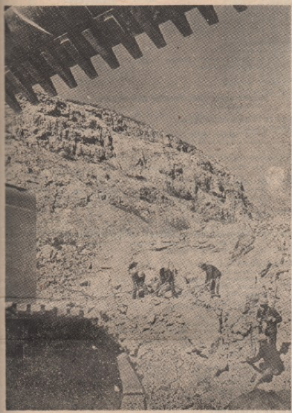
Олачујућа реч радника — рудари на копу кречњога камена у Заграву