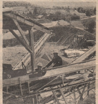
рада у Бору. Добар део радника се заврешно школовау на високим и вишим школама такође за рачун и у интересу предузећа.

КАДРОВСКА ЛЕГИТИМАЦИЈА: Комунално-услугано предузеће „Компред“ започело је свој рад са око 80 радника, махом некавалификованих. Данас организација удруженог рада Грађевинско-производног предузећа „Бор“ у Бору има око 50 радника са високом и вишом школом, око 300 квалификованих и висококвалификованих радника, са средњом спремом око 70 радника а остали су некавалификовани и полукавалификовани радници. Овај број биће знатно смањен јер треба да стекне квалификације при школи за квалификоване раднике у процесу