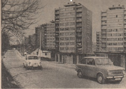
Зграде и улице — дело радника ГПП „Бор“