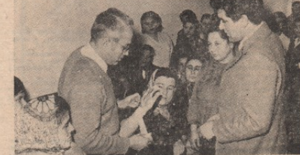
Грађани Пете месне заједнице на курсу

Програмом обукe је предвиђено да се у свакој месној заједници одрже курсеви са 30 часова кроз који ће, како се предвиђа, проћи око 1.200 грађана. Такође