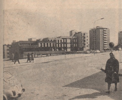
На истом месту сада се налазе Дом културе и модерни саонтери