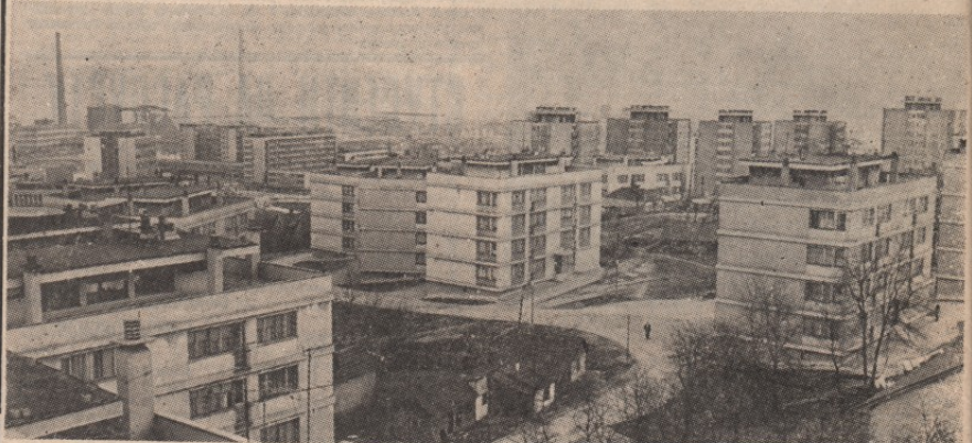
Бор расте — у висину и ширину. Само за одржавање постојећих станова утрошено је преко 4,5 милиона динара

ЗНАТАН ПОРАСТ ТРОШКОВА ИНВЕСТИЦИОНОГ ОДРЖАВАЊА • УКУПНИ ГОДИШЊИ ПРИХОД МАЊИ ЗА МИЛИОН И 390.000 ДИНАРА