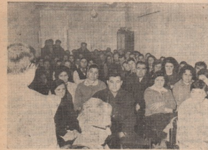
Бирачи Пете месне заједнице

Зборници бирача у сеским програм мера здравствене заштите међуопштинског већа, који су штите станицама и програм одржали 17. и 18. марта, раз-