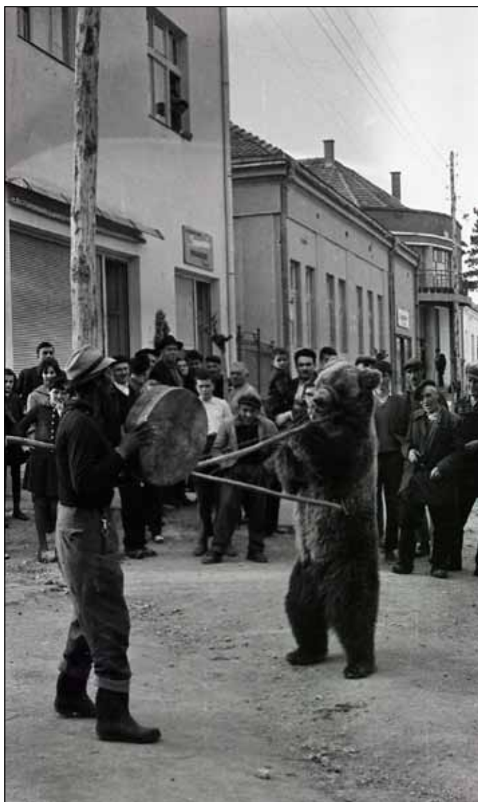
Igraj, igrjaj, igrjaj