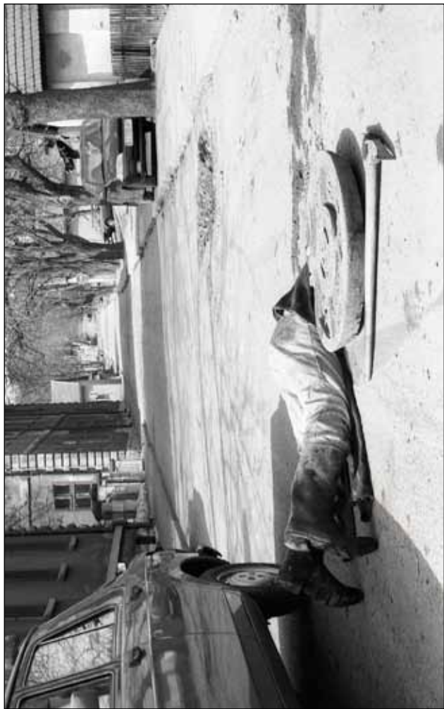
Gaziš ulicom i: Rupa