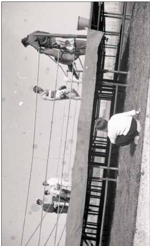
Telo i grad