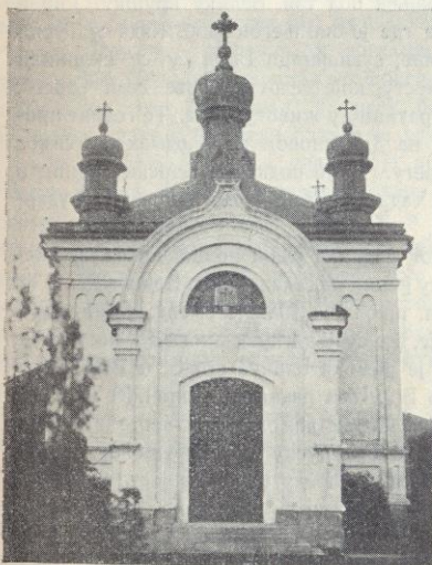
Црква Св. Ђорђа у Бору

Црква — До отварања рудника и подизања радничке колоније Бор је био мало село, те није имао своје цркве ни свештеника. Дотле је он потпадао под брестовачку парохију. Село