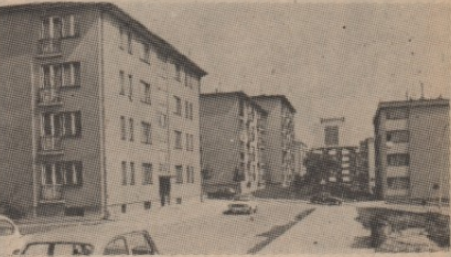
НАСТОЈАЊА: изједначавање услуга на нивоу Републике

Олакшине, истина, нису велике. Станарина са „најпљивим ценом“ коришћене ове „довластине“ може уштедети веома малу, симболичну суму од неколико хиљада старих динара. Ипак, зачување што је многи који имају право не користе. У Предузећу „Стандарда“ претпостављају да у Бору има више грађана које би ова одлука могла интересовати.