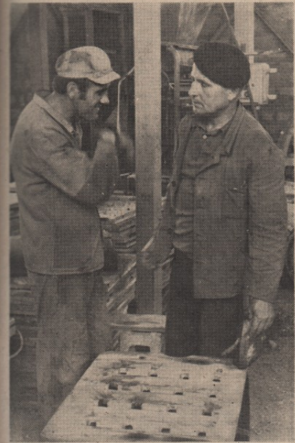
ЗАДАТАК ЈЕ: максималним залагањем оправдати поверење купца и испоручити на време уговорену производњу

У току ове недеље биће завршена управна зграда ООУР Фабрике грађевинског материјала. Ова зграда представља никакву новину у кругу раног колектива, јер је она требала да буде готова крајем прошле године, али извођачи радова (Грађана) су тек ових дана радове привели крају. Нови објект изграђен је сопственим средствима у износу од 230 хиљада динара, а решење питање смештаја радника из управе који су до сада користили пословне просторије ООУР Грађана.