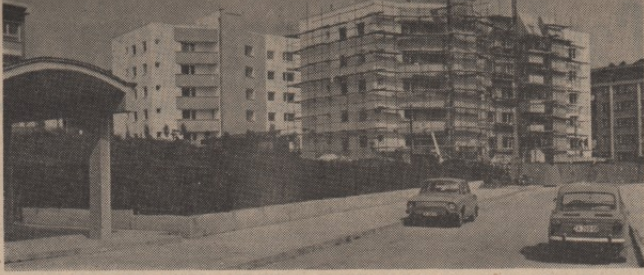
ВЕЋ У НОВЕМБРУ: 78 радничких породица уселиће се у нове станове

Сваки од осам породица радника нискокумулативних радних организација добиће у овој години кров над главом. У наредној години — још четрдесет