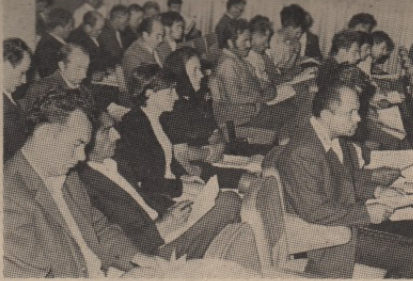
ОДБОРНИЦИ: амандмани су потреба сваког радног човека

До краја седнице одборници су приватни и предлози о годишњем завршном рачуну порезе грађана општине Бор, о укидању Фонда за изградњу Дома културе, затим, предлог решења за оделења средстава из буџетске резерве — Организационо одбору библиокастичке трке кроз Југо-слављу, међуопштинској