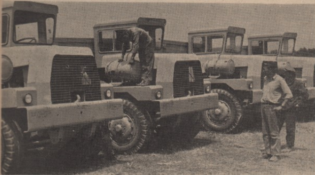
СВЕ ЈЕ СПРЕМНО: за остварење планиране производње нема бојазни

Каменоломима у Заграђу и Кривељу од данас ће забрујати нова механизација која је пре извесног времена увезена из Билгеске. То су пет тешких камиона-кипера, марке ТЕРЕКС носивости од по седамнаест тона.