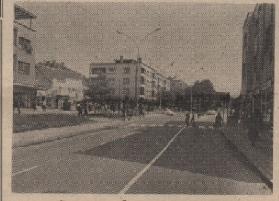
... сада је модерни булевар и шеталиште младих