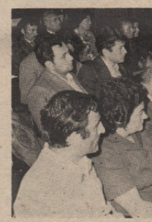
Међуполитичка заједница запошљавања Бор о припремно недовољним

Требало је да се на седници Скупштине Међуполитичке заједнице за запошљавање радника, одржаној прошле недеље у Кладоу, одлучено је да се, с обзиром на пораст трошкова живота, привремено независним, ацима која су на евиденцији Завода повећа новчана накнада за 13,4 одсто, колико је утврђен пораст трошкова живота у 1973. год. Такође, утврђен је највиши износ који ће се исплативати привремено независним на 550 динара, а највиши на 1.400 динара.