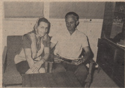
ЉУДСКИ ОБЗИРИ: колико топлине и среће доноси нов стан

На самом северу Старог Селишта под багреном шумом извила се нова четвороспратница. Настала је из жеље рад-ника Грађевинско-производног предузећа „Бор“ да обрину своје раднике, а у време када се тек почело говорити о рад-ничким становима. То у суштини значи да су претече акту-елног друштвеног момента када је реч о решавању пробле-ма радничког стандарда. У тој стамбеној згради, у којој су услови становања скромни, смештено је тридесет поро-дица, које су после вишегодишњег потугања и „крпања живота“ нашле своје уточиште.