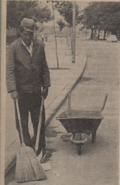
СВАКОДНЕВНИ ПРИЗОР: занимање толико неопходно а у исто време непризнато

Напоран рад, лични доходи ниски, а запослени углавном старији људи — то је једна од карактеристика основне организације удружења Чистоћа