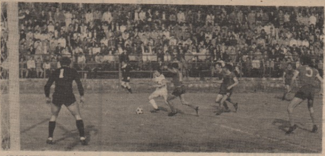
АРАГОЦЕНИ БОДОВИ: голом Борвевна борски „дрно-бели“ заслужено победани Никшињу Сутјеску

ПЕТОМ: 16.00 Певачу и свирачу за вас ансамбли и солисти народне музике 17.30 Музички каталог