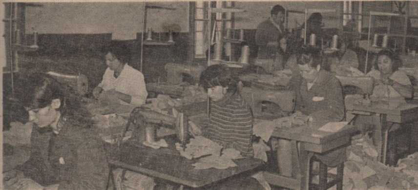
Произвођачи у удруженом раду стварајући средства — треба да о њима у самоуправном процесу и олачују

Седница скупштине општине Бор, одржана половином јуна, протекла је у знаку разматрања примене уставних амандмана у радним организацијама општине.