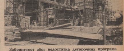
Забринутост због недостатка дугорочних програма развоја

На заједничкој седници је посебно изражена забринутост због недостатка потпуних и дугорочних програма развоја већ се радне организације задовољавају привременим и непотпуним решењима. У већини организација још увек не постоје службе за програмирање развоја, службе за планско-аналитичке послове, за пра-