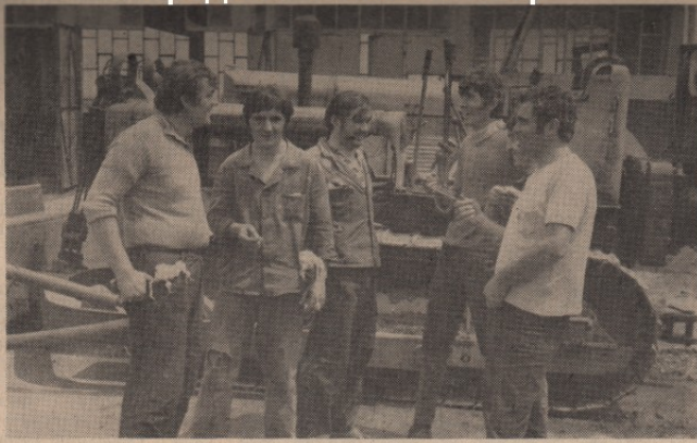
Решење стабеног питања битан преаулов стандарда

бараке, који ће служити искључиво за становање, постоје и две, нешто мање, од којих је једна погодна за смештај друштвене исхране а друга за помоћне хигијенске просторије. У њима се може сместити 170 радника, што значи збрињавање скоро свих незбринутих. Објекти се налазе на „Старом Селашћу“. Сматра се, да ће у неким већим собама моћи да буду усвојена и породице које ће тиме регистрати, само привремено, свој проблем до погодније прилике.