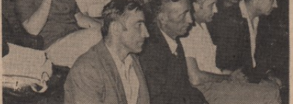
Упоредна анализа — сагледавање сопствених могућности

Треба још рећи да ће, један број станова бити, прецењеном они који у њима станују у нове станове, ослобођен и додељен другима.