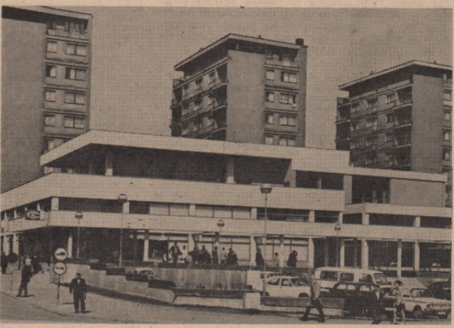
Дугорочна и јасна развојна политика у трговини и угоститељству — једини могућност да се одржи корак са другима

редства, а такође и дошу квалификациону структуру. Тако, на пример, „Центропром“ за обртна средства и инвестиције недостаје око шест милиона динара. Због тога су његови представници захтевали да им бавље, пре свега, бор и пословно политику. Подаци из ове анализе и оних које ће Завод датирава. Јер, инвестициону ула-