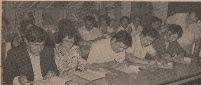
ИСПУЊЕНИ ЗАХТЕВИ ЗБОРОВА РАДНИКА: потписивање Одлуке о организовању

Представници шест радних јединица Медицинског центра у Бору потписали су у уторак, 3. јула, на свечаној седници Радничког савета Одлуку о организовању јединствене организације удруженог рада. Потписана Одлука има снагу самоуправног споразума јер се о њој изјаснили зборови радника свих шест радних јединица, након што је комисија за спровођење уставних амандмана усвојила, почетком јуна, нацрт ове одлуке.