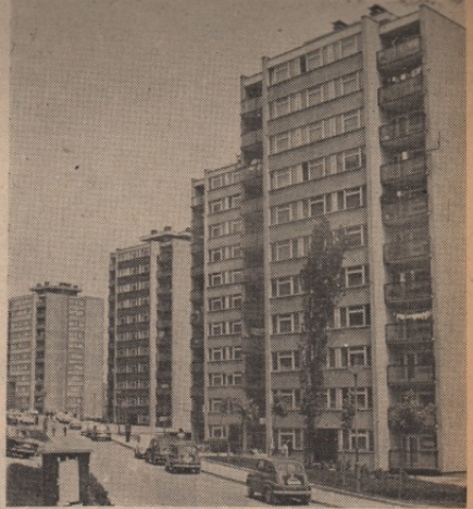
Проблеми стамбеног фонда треба да буду решени реформом интересних заједница становања

Посебне дужне расправе, у којој су заштити стандарда грађана и очување реалне моћи њихових личних прихода били основни разлози иза којих је бојазан да осветније повећања цена комунално стамбених услуга и станарине, одборници су се сложили да је, ипак, потребно формирати нове цене у комунално стамбеној привреди. Јер, садашње стање у овој области, и поред анализе Основне привредне коморе у Зајечару која показује да је предузеће „Стандард“ у најповољнијем положају у односу на све друге градове у Тимочкој крајини,