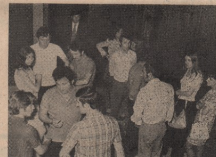
И У ПАУЗИ САСТАНКА: о проблемима омладинске организације

констатовао да је идеолошко-политичко образовање сеоске омладине на независном нивоу а исти случај је и са културно-забавним животом.