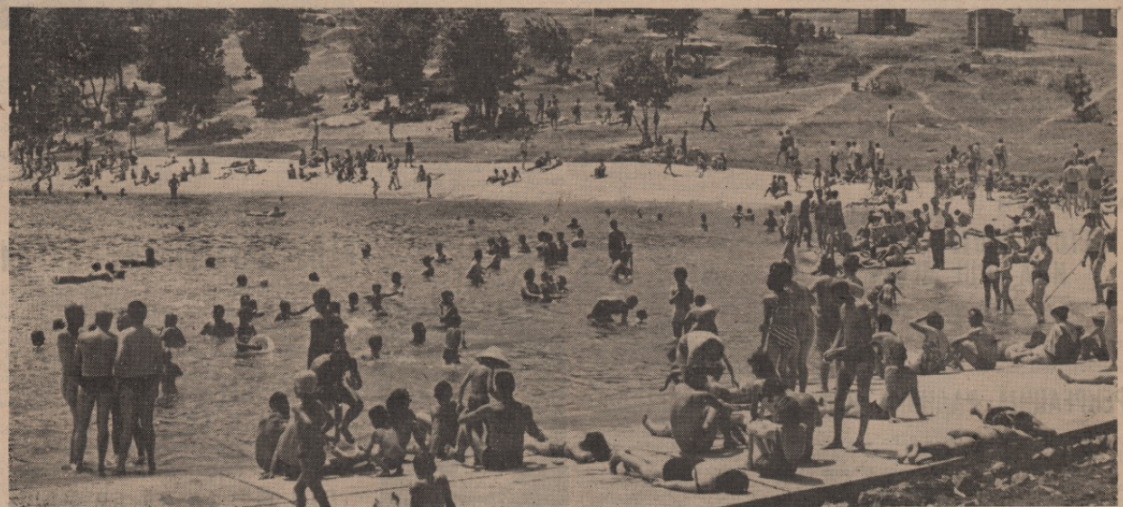
Када јули и август дођу и жива у термометру се попне на тридесетак и више степени Борско језеро је омиљено место где грађани и туристи потраже уточиште у топлим поподневима. Тада улице града остану без људи који градску спарину замењују свежином, коју пружају излеташка језера и Брестовачке бање. За време викенда ове излетничке терене преплава неколико хиљада људи. Плажа, неколико угоститељских објеката и могућност за бављење риболовом све више привлаче радног човека да после „шихте“ предахне у пријатном амбијенту оближњег Борског језера

Нестанак струје је, уз то, изазвао кварове на неким агрегатима у топловизи, флуорацији и алуминици. На П. хоризонту у Јами морале су бити предузете ванредне мере одбране. Спштена су такзована водна врата Јер су велике пазе биле заустављене. Претпоставља се, јер штета још није сасвим утврђена, да је у борском делу Басена због нестанка струје изгубљено око десет милиона динара.