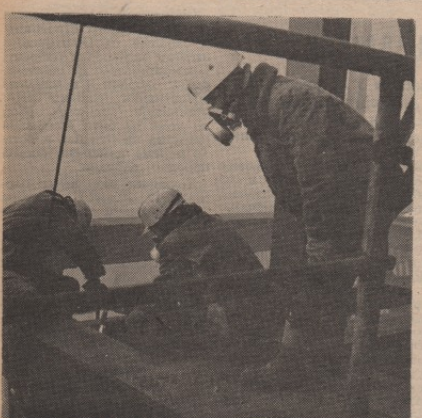
Зеленило може да измени изглед града, али на радном месту — потребна је интензивнија заштита човека

Познато је да зеленило знатно утиче на ублажавање климатских екстрема, а тиме се смањују у здравственом погледу, штетна колебања метеоролошких фактора. Помоћу лишћа, као свог транспирационог апарата, зеленило испарава знатне количине воде. На тај начин оно освежава околину, јер оаузима топлоту ваздуху који га окружује. Зависно од врсте биљке, количине зеленила, његове транспирационе моћи и интензитета испаравања, утрощак топлоте варира. У време спарних