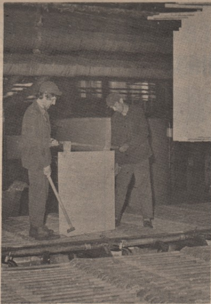
За исти рад и резултате рада једнака зарада — како то остварити

Новинари су упознати са реализацијом Петог правца Басена и проблемима и перспективама тог развоја. Том приликом новинари су упознали директора Јовановића са неким проблемима у обављању својих задатака.