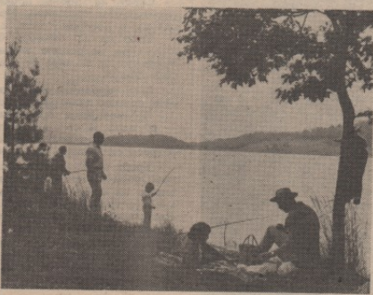
Борско Језеро све привлачије за туристе

И поред тога што је око 4.000 грађана Бора користило своје годишње омаоре преко Инекс-туриста и што се до краја године планира да услуге за коришћење годишњег омаора ове туристичке организације искористи још пет стотина до хиљада грађана, ипак је број корисника, већ сада се може рећи, знатно опао у односу на прошлу годину. Додајући овоме да је 75 осто корисника годишњих омаора боравило у бањским омааранштима, морамо се заштити зашто се наш радни човек све ређе одлучује да свој годишњи омаор проведе ван Бора, иаи на мору.