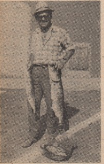
... ипак је тежа ова у левој ризи

Да у Бору постоји удружење риболоваца, добро знају сви. Риболоваци је много и сви су они страни,