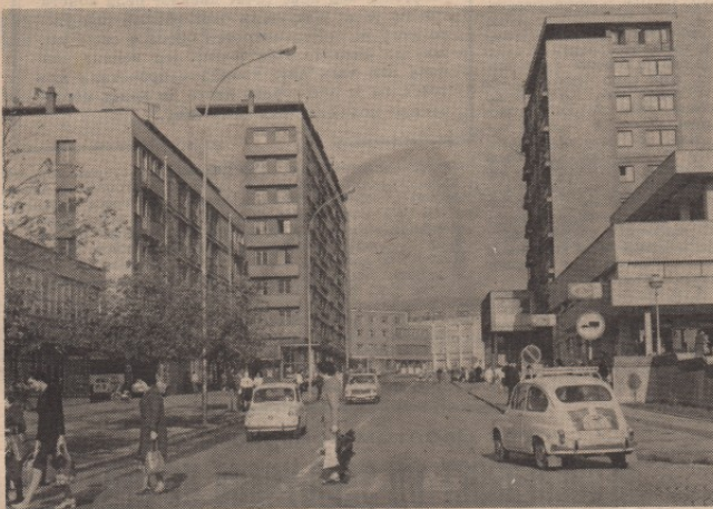
Свако ко у Бору гради ужива бенифиције. Уложени динар — доноси два, стварајући тако могућност за отварање нових радних места