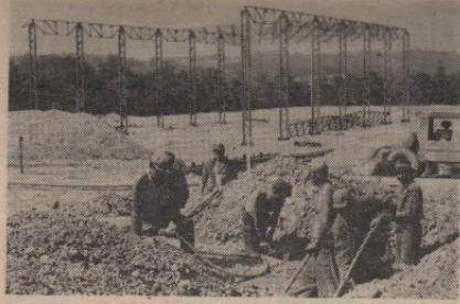
Већ априла маћуе године на Борском тржишту појавиће се, први пут, силикатна опекa.

Подизвоач радова, „Мостоградња“ из Београда је у закашњењу са радом и у старту, а и у самим радним операцијама. По плану је било предвиђено да се челичне конструкције једне од хала поставе за месец дана, а радови већ трају два месеца и тек су сада у завршној фази.