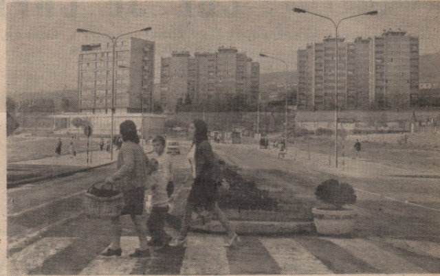
ВЕЋА ЧИСТОБА ГРАДА: то

ку наредних петнаест дана на сваки позив кућних савета предузети мере и извршити смеће избачено из подрумских просторија, а затим извршити дератизацију и дезинфекцију подрума.