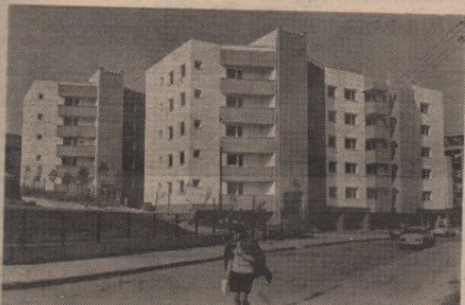
Ко је крив што 60 станова чека станаре већ два месеца?

узељене. Зграде су завршене пре два месеца, 60 станова је било спремно да прими станаре почетком септембра, а поред тога станови још немају станаре.