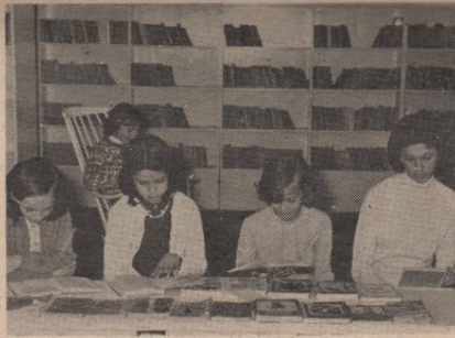
Марксистичке литературе још увек нема довољно ни у књижарама ни у библиотекама

Основ за постављање и остваривање таквог програма делатности библиотеке — књижни фонд који тренутно располаже 42.717 књига, 25 комплета разних часописа и др. Овае треба имати у виду и мрежу библиотека у коју улазе сеоске библиотеке и књижнице са преко 7.523 књиге, као и књижни фонд школске библиотеке (Гимназије и Техничкогшкошког центра) са око 12 хиљада књига. Успешном ра-