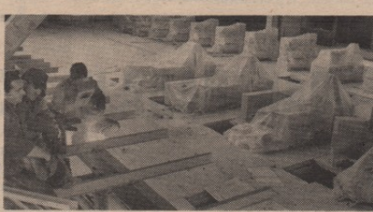
Ускоро нова радна места у Фабрици лак жице

Инвеститор је поред Градње ангажовао и београдски „Рад“ као извођача, који је требало да обави део послова (зидане и постављање кровне конструкције). Међутим, радници овог предузећа нису обављали своје уговорне обавезе на време, па су тиме изазвали застој и на радонима које су обављали радници Градње, пошто они прате радове извођача.