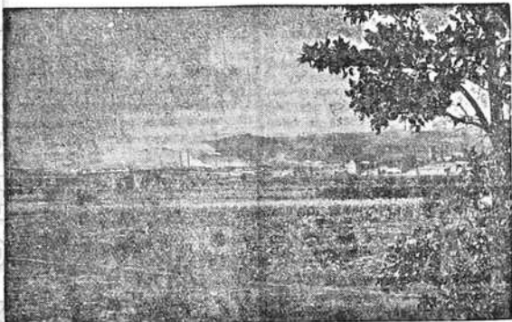
Дим из димница у Бору

После рата компанија је зарадила преко пола милиона франака