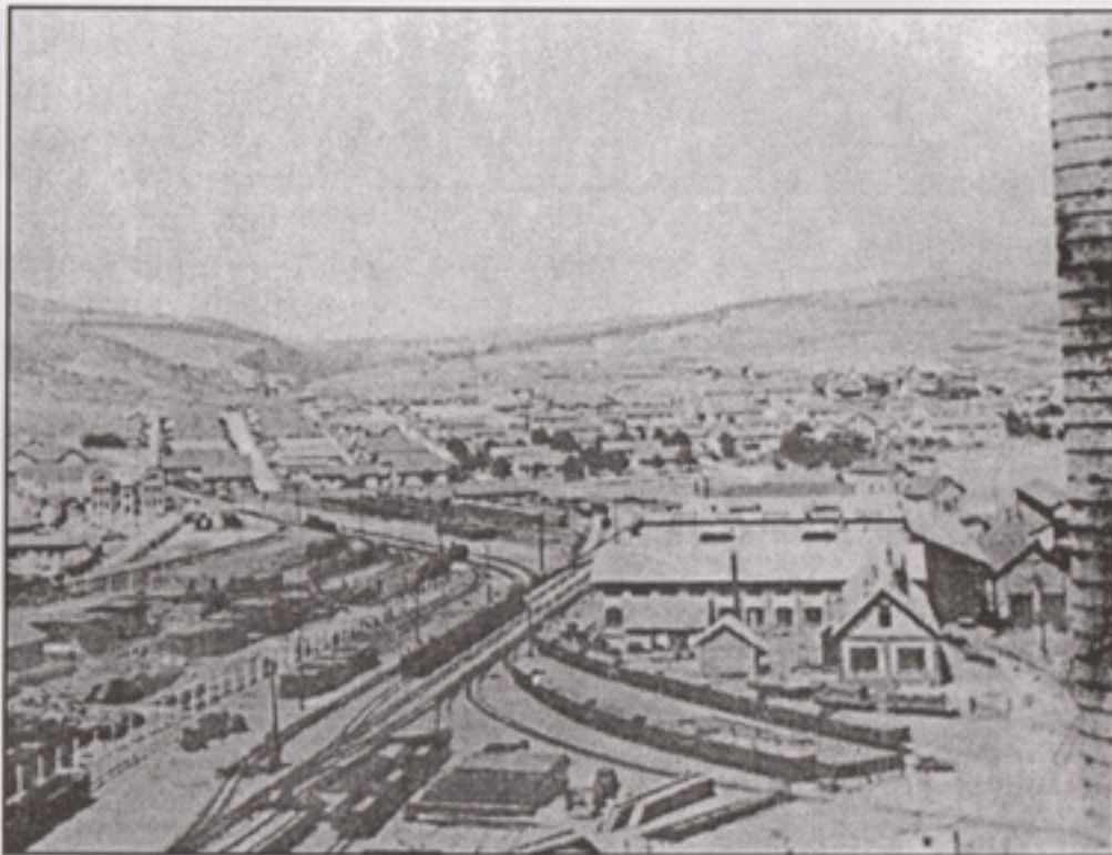
Детаљи сѐараи Бора, снимак из 1937. године

продавница, кафана и сличних објеката. 19