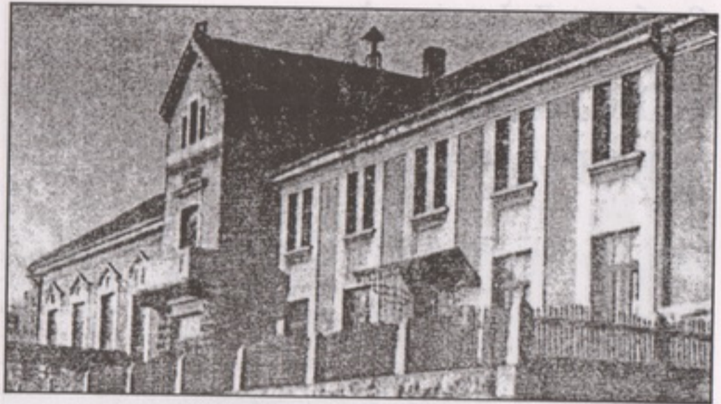
Данас: Рударско-металуршки факултет, некада: Француска касина

Од свих напред побројаних друштвених група, за развој града Бора најзначајнији утицај су имали Французи и од њих ангажовани руски емигранти. Живот страних држављана одвијао се одвојено од осталог становништва. Французи су се окупљали у својој касини, прекрасном здању које је у свом архитектонском склопу имало огромну салу за балове и забаве, концерте и представе. Ту су довођене најзнаменитије личности Краљевине СХС и, касније, Краљевине Југославије. Овакав вид културног живота је био недоступан