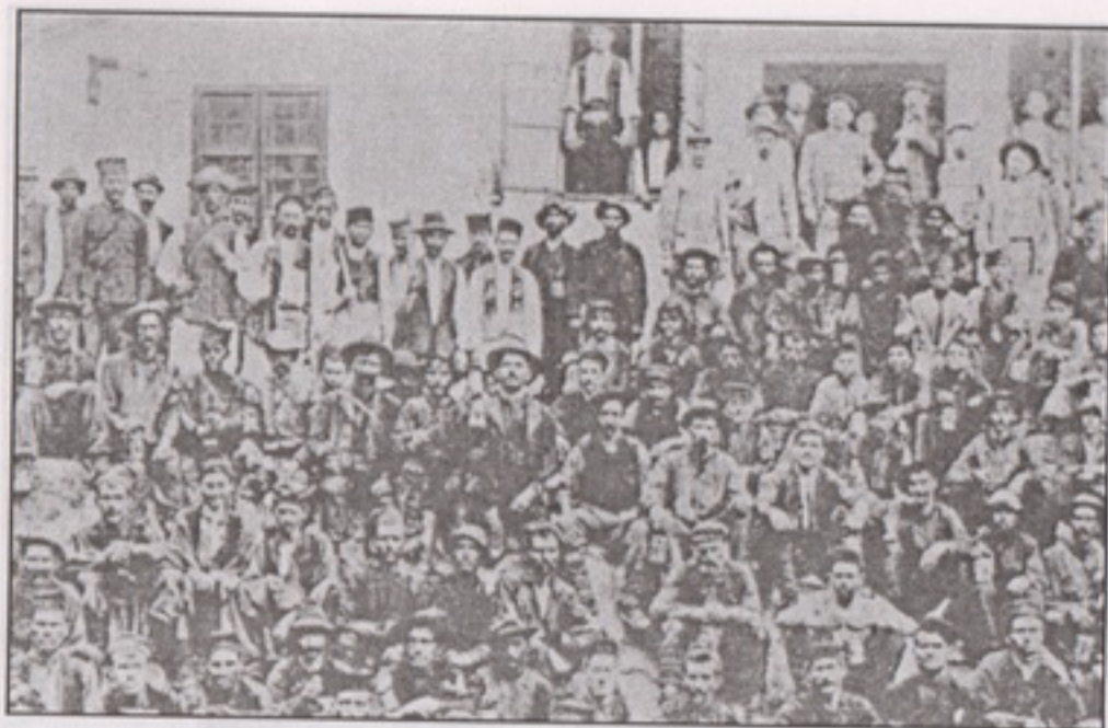
Група рудара 1912. године

Локално влашко становништво, незаинтересовано за цркву, остајало