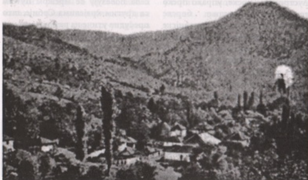
Бор-село ѝре ѝочешка радова (Музеј у Бору)

Шире посматрано, ово подручје било је добро насељено још од доба енеолита (2) и каснијих периода праисторије, позне антике и рановизантијског царства. Представљало је граничну и периферну област североисточне Србије, удаљену од главних путева, раскрсница и трговишта; подручје које је у том контексту, ипак, имало важну улогу у повезивању и прожимању ширих географских области, удаљених и међусобно различитих, али, свакако, специфично, пре свега по природним богатствима, али и етничкој симбиози становништва и њиховој култури. Својом израженом друштвеном и територијалном организацијом у тој симбиози имали су утицаја: Трибали, Скордисци, Римљани, Хуни и Готи, Тимочани и Браничевци; спорадични упади Бугара и Мађара; Турци. (3) Миграционе струје које су, од 15. века наовамо, доводиле и одводиле бројно становништво на овом подручју, ипак су оставиле