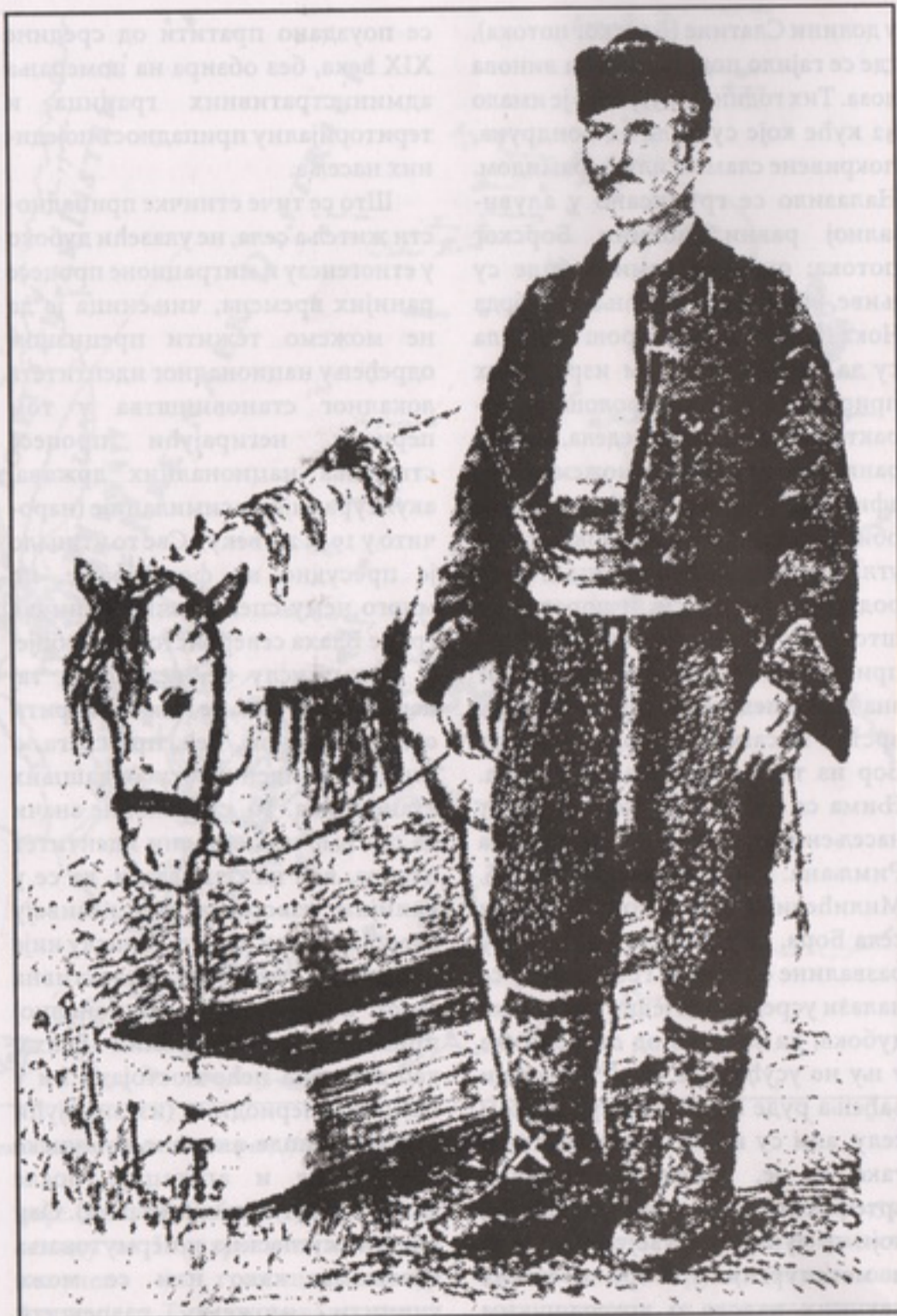
Сѣановник борске околине из 80-их година 19. века (В. Карућ)

Куће су задовољавале најосновније потребе људи и могле су бити скромна станишта, али и развијене архитектонске форме које обухватају и пратеће објекте привредних зграда. Биле су распрострањене различите варијанте кућа од дрвета (бурунџача, дрвњача; примитивни облици склоништа: бурђеј, чучуљака која је слична савардаку), које је било основни грађевински материјал (у каснијим периодима могао је бити комбинован и са неким другим материјалом: блатом – бондручаре,