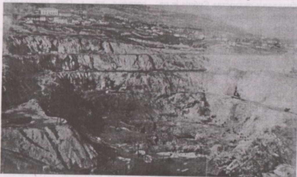
Површински кој Чока Дулкан средином 30-их година прошлој века

Важно је напоменути да је стварање оваквог система управљања и руковођења, формирање квалификоване структуре запослених, креирање једног посебног менталитета у оквиру високо организованог колективног деловања (стручност, радност, професионални однос, одговорност), временски превазишло постојање ФДБР-а. И дуго година после Другог светског рата, овај дух и однос према раду и предузећу оних у француско време формираних кадрова – носилаца производње – битно је опредељивао радни ангажман и напоре у правцу успешног рада РТБ Бор.