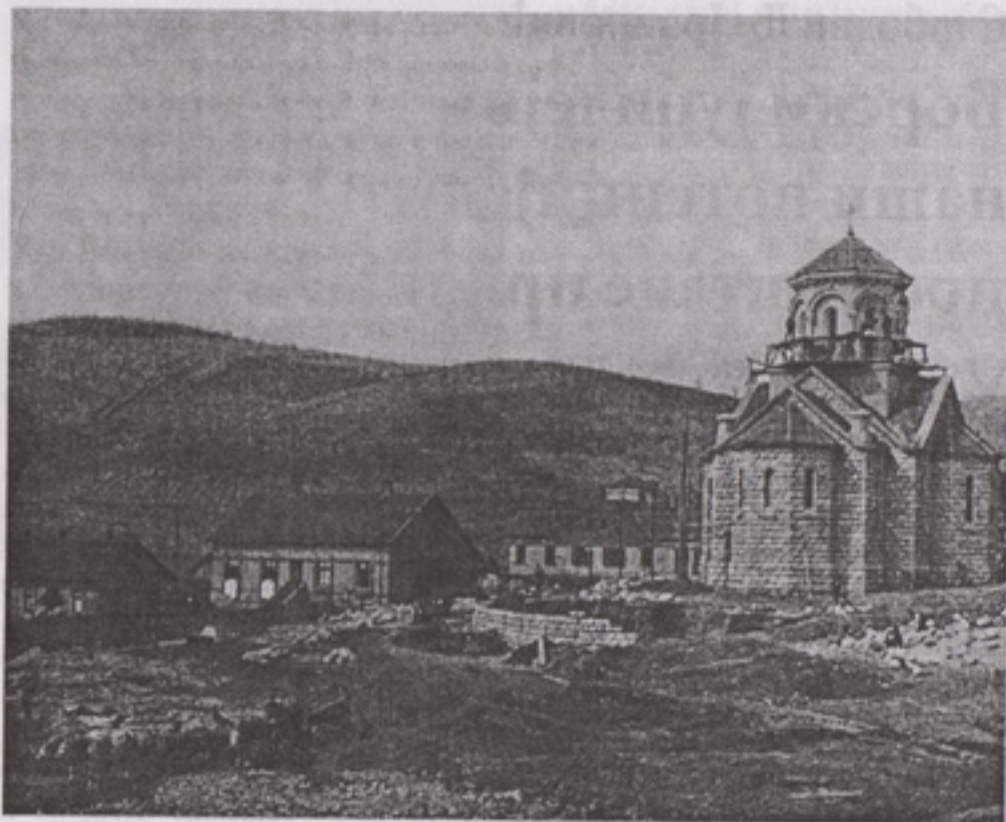
Изградња нове православне цркве Св. Ђорђе у Бору

Први епископ тимочки, Доситеј Новаковић, посвећен је на Сретење 1834. године. Избор епископа Доситеја пада у оно време када је Милош Обреновић обилазио новоослобођене нахије (1833). Тада је Доситеј назначен од стране кне-