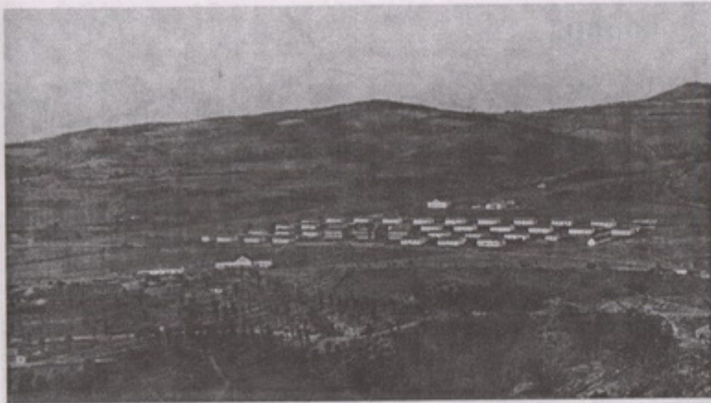
Кафана „Весели рудар“ (у њвом џлану) и џочеци џзв. „сѝаре француске колоније“ (џрва деценија 20. века)