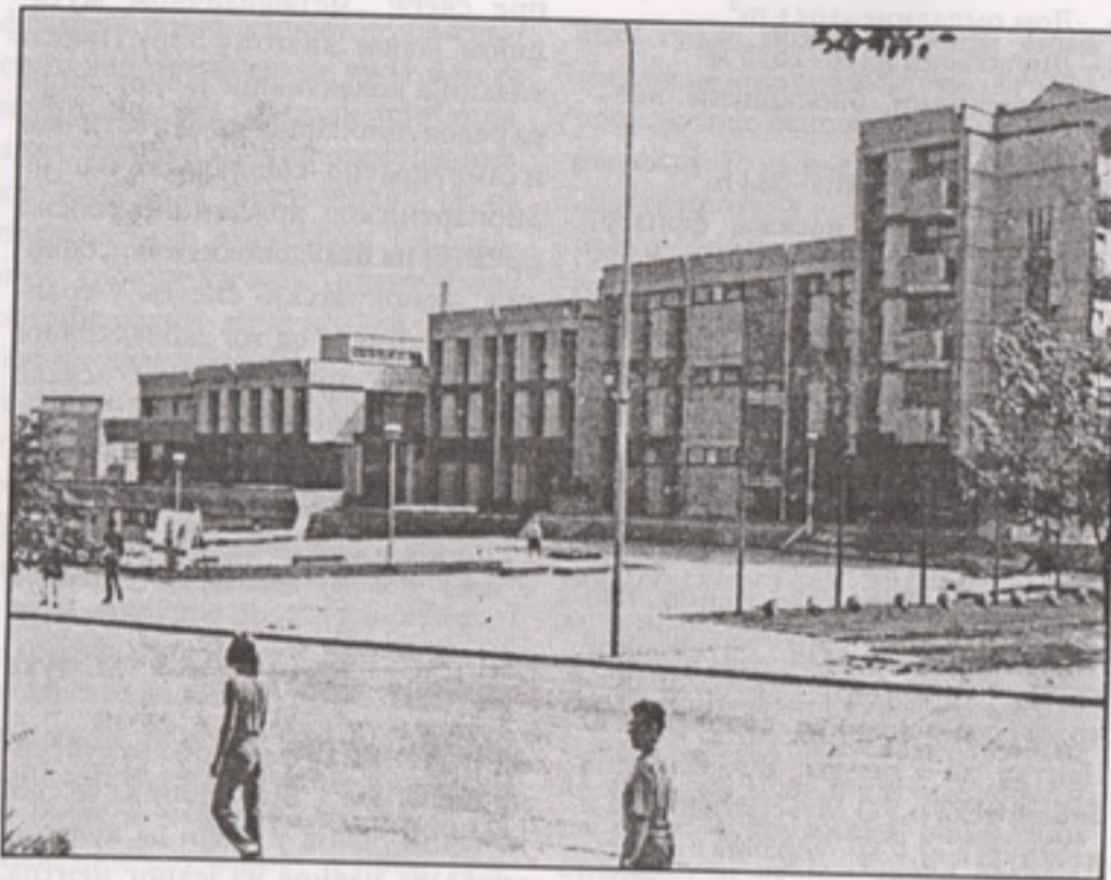
Дом културе у Бору

а прича о јавном моралу постаје одвратна метафора о цензору. Слобода и суштина стварања има свој центар у човеку. Слободни смо, дакле, за друштвену слободу; али да ли осећамо жељу да будемо ослобођени од ње?