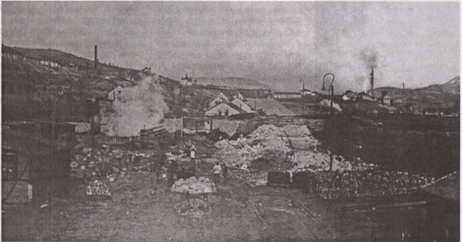
Почейни радови на Чока Дулкану

Вајфертови покушаји и прегнућа у рударству Србије, у моменту када су његови губици износили милионе динара, крунисани изванредним успехом.