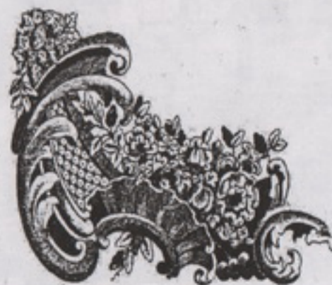
© Јанковић Јован, Београд, 1914. Гравировање Ј. Ј. Јовановић, 1914.

златоносне терене источне Србије. Али највеће његово откриће јесте откриће борске бакарне громаде. Тиме су са изванредним успехом крунисана вишедеценијска прегнућа Феликса Хофмана у рударству Србије”.