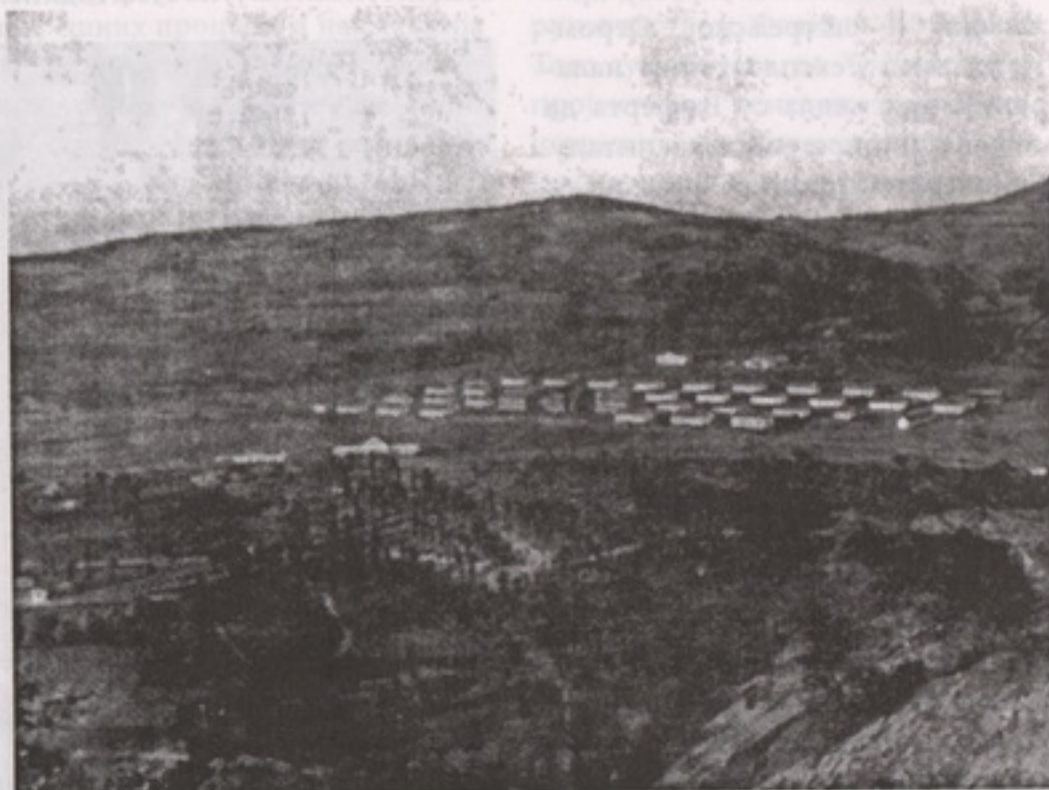
Бор – насеље 1909. и зграда ујраве рудника

Овај рудник пронашао је наш вредни, енергични и предузимљиви