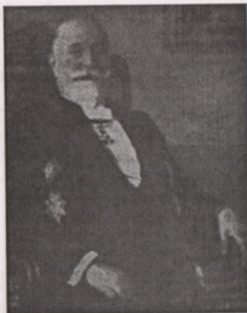
Ђорђе Вајферт, 1850-1937

Тако је Француско друштво Борских рудника у извесном смислу постало саставни део мреже међународног приватног капитала, што је било од изузетног значаја за развој Борског рудника, па самим тим и Бора и борског краја.