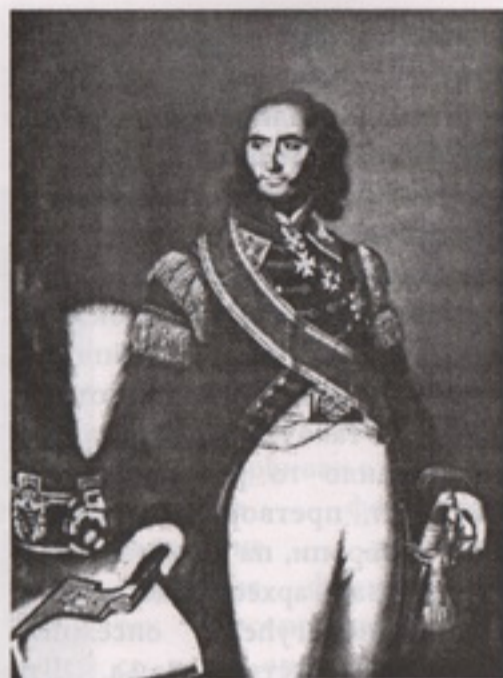
Барон Хердер (Музеј у Бохуму, Немачка)

Ипак, прво озбиљније истраживање, које је осамдесетих година 19. века извршио утемељивач српске геологије Јован Жујовић, указало је на то да је Хердер био у праву. У првом делу своје Геологије Србије он је написао и следеће: „Сребровита руда нађена је у Бору. Бакарне се руде налазе у Кривељу, Бору, Бучју и Црном врху. Олово у Кривељу. Гвожђе у Бору, Злоту, Бучју и Брестовцу”. У другом делу Геологије Србије Жујовић је са више детаља описао геолошки састав борске околине.