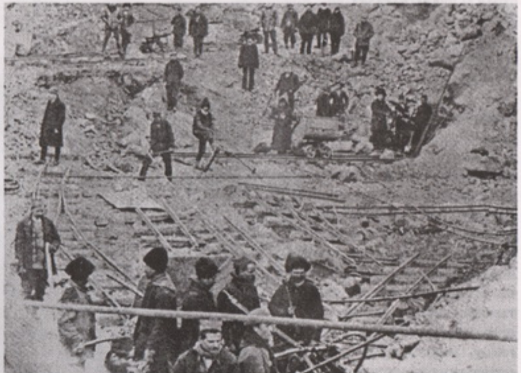
Почейни радови на йовришинском коју (Музеј у Бору)