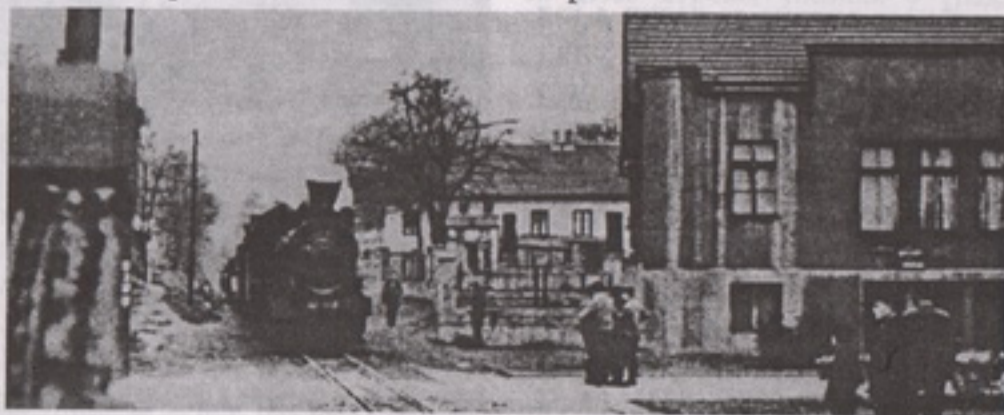
„Бира“ у (некадашњем) центру Бора

Што се тиче великог борског гиганта, њега сам мало слабије познавао, јер ми из гимназије нисмо залазили у круг рудника, топионице, флотације. То су редовно чинили ученици Средњотехничке школе,