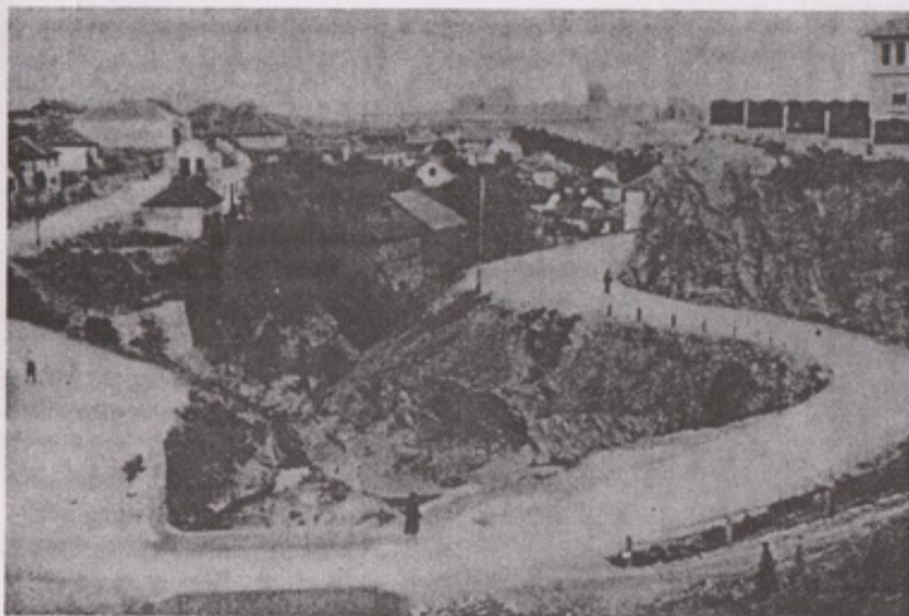
Велика кривина испод школе „В. Караџић“ и сџари мостџ испод коџа је „урлао“ Борски џошџок у време великих киша. Лево у даљини, види се Градски одбор а џреко џушџа је Ледара. Данас – Градски џарк и џараже.