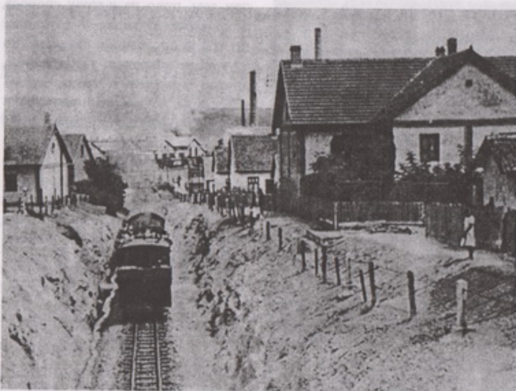
Усек ђруле са мостом са кога је ово снимљено, кад се крене из Бора и ђрође рамиа

га опет сачекати и без проблема ускочити, јер је скоро милео.