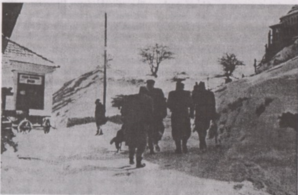
„Путџ џреко џошџока“ - чувена џречица коју су људи са Друјџџ километџра и Нове колоније корисџили за одлазак у Град или на џосао. Ми „манџуџи“, смо је зими клизањем џлачали, џа се џосле смејали ономе ко џу џадне

Што се тиче пруге и воза, то је био малени „Ђира“ како смо га, из милоште или ругања звали, мислећи