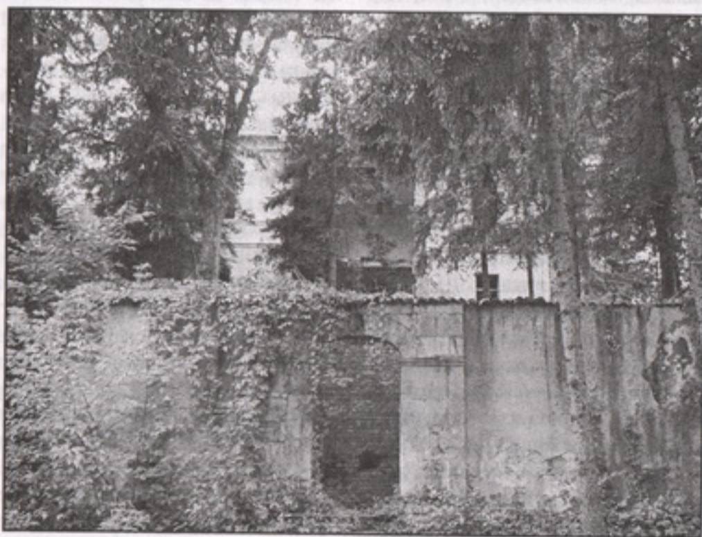
Кнежев двор, снимљен 2005.

Значајно је то што је уже подручје Брестовачке бање 1991. године проглашено културним добром, односно просторно културно-историјском целином. У последњој деценији двадесетог века бања као друштвено предузеће бива поверена управи Туристичке организације општине Бор. У том периоду постигнути су запажени резултати. Осим сређивања околине и уређења бањских објеката, изграђен је хотел „Српска круна“ и наткривен је мост на Црновршкој реци, на улазу у бању. Са сталним ангажовањем ле-