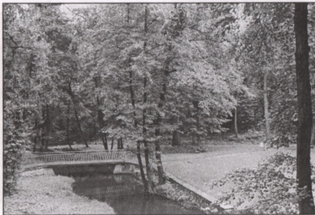
Бањска шума, снимљено 2005.