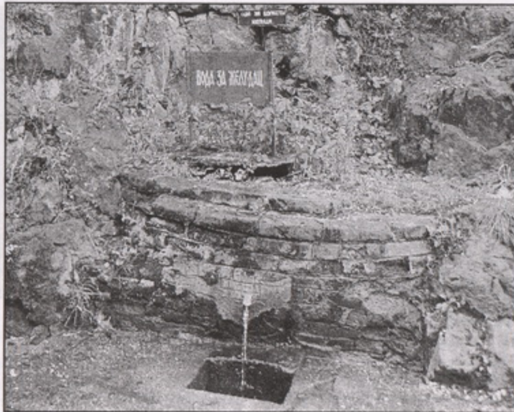
Бањски извор, снимљено 2005.

скоро чаробно; за уметнике инспиративно, за песничку слику, сликарско платно или ритам песме.