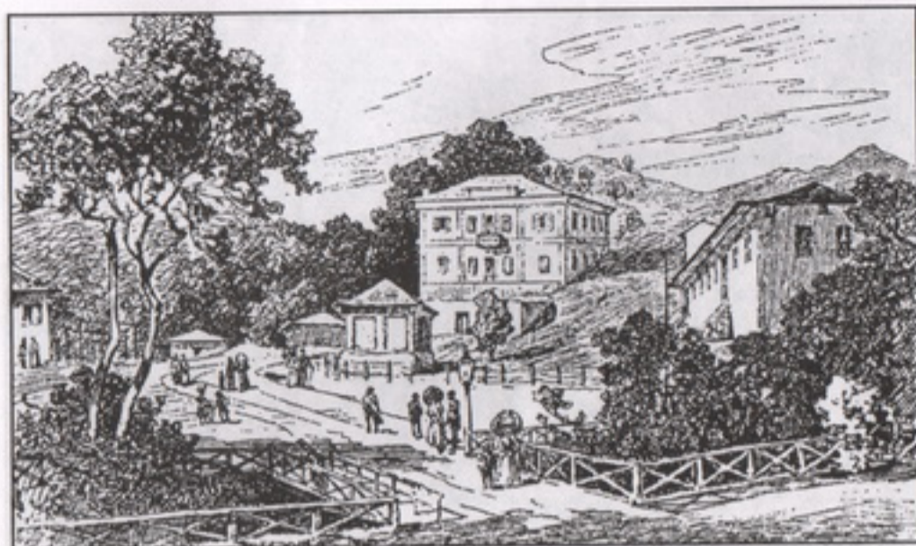
Брестовачка бања на крају 19. века, цртеж Феликса Каница