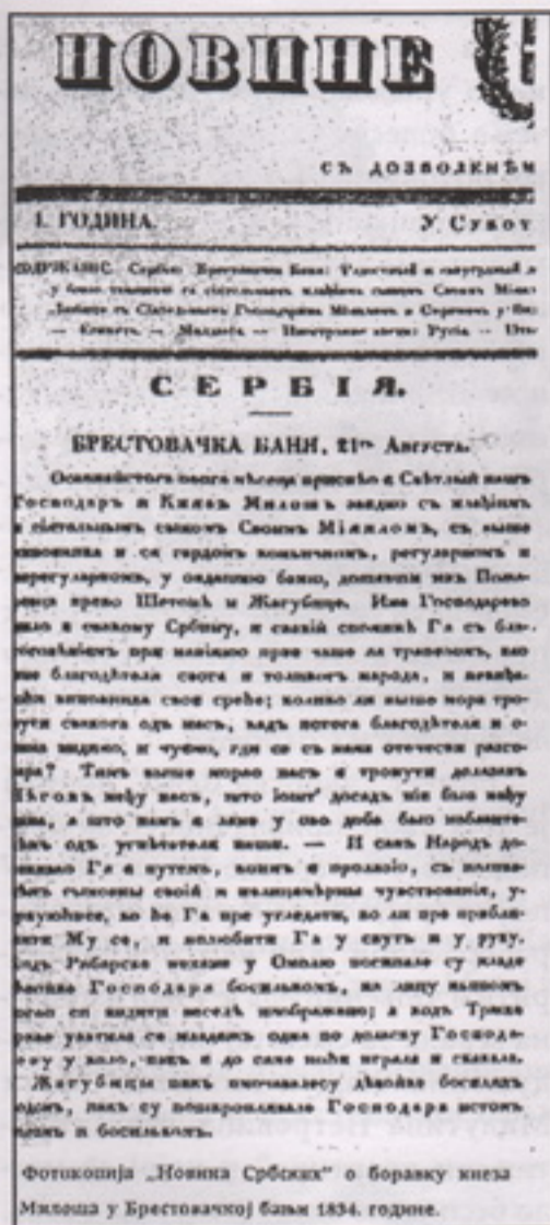
Новине Србске, бр. 35, 1834

„Ако се камен не заштити, за неколико година ће вода и лишај учинити своје и натпис ће се изгубити”. То се и догодило.