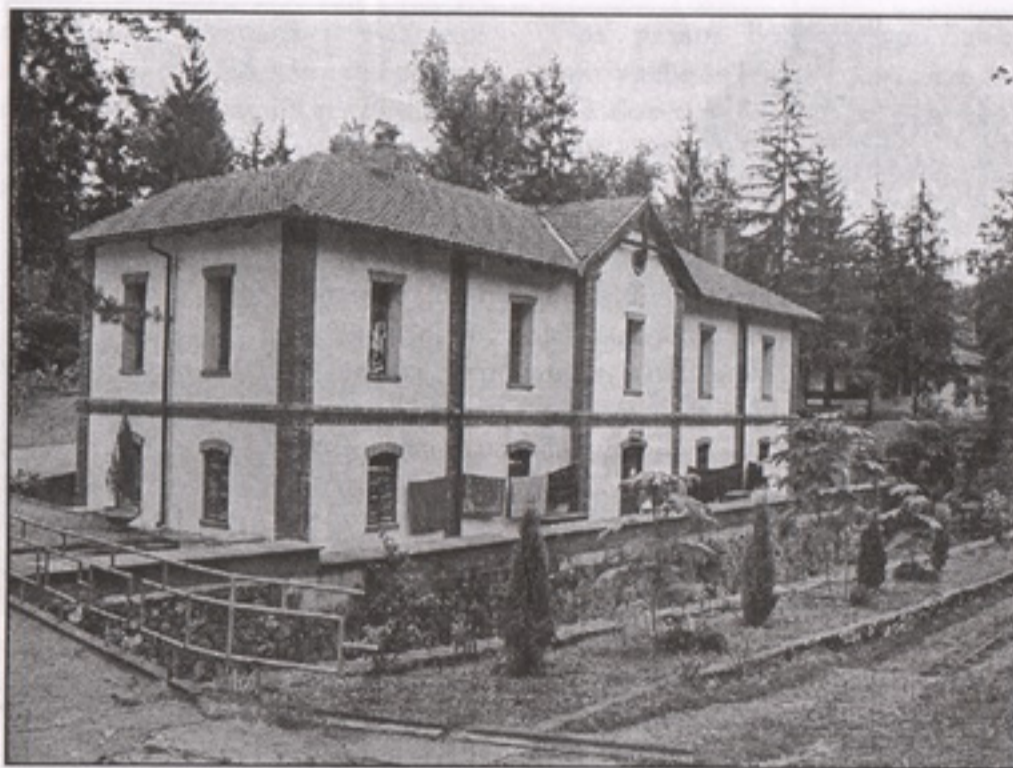
Бањско куќаишло, задужбина краља Петра Првог, снимљено 2005.

Откриће борског рудника, догађај од непроцењиве важности за Србију, у потпуности ће променити будућност сиромашног Бор-села, а утицаће и на даљи развој Брестовачке бање. Да би се прецизније одредило место проналаска руде бакра, уз Бор-село се обавезно наводио срез, округ и близина Брестовачке бање. Бања дуго бива одредница за мало Бор-село. „Па чак уочи првог светског рата, да се поближе одреди положај Бора, говорило се да је он код Брестовачке бање, као места боље познатог него што је борски рудник.“ 11