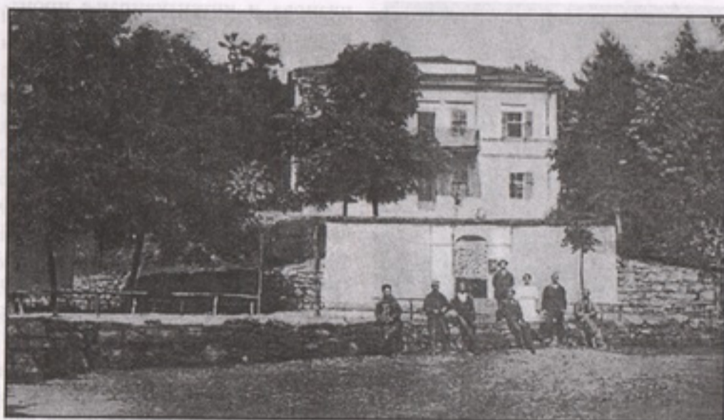
Кнежев двор, разгледница из 1908. године

лазак околине, утицаће да се седамдесетих година граде нови објекти за прихват гостију у близини Брестовачке бање. Тако се туристима омогућило упознавање околних туристичких знаменитости и природних лепота: Лазареве пећине и Верњикице, омладинског летовалишта Савача, Борског језера, планина Црног врха, Стола и Дубашнице. Према свим овим туристичким вредностима, бања има повољан положај и са њима чини јединствену целину.