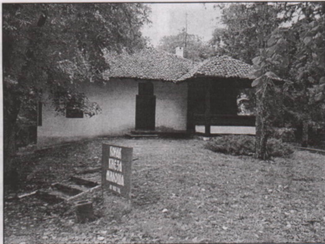
Конак кнеза Милоша, снимљено 2005.

Посета Источној Србији имала је политичке разлоге. Било је потребно договорити виђење књаза са видинским Хусеин-пашом. Кнегиња Љубица након што је и сама „употребљавала купељи” са пратњом је из бање отишла у Видин у својевр-