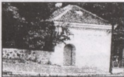
Амам кнеза Милоша

своја два малолетна сина, шеснаестогодишњим Миланом и четири године млађим Михајлом.