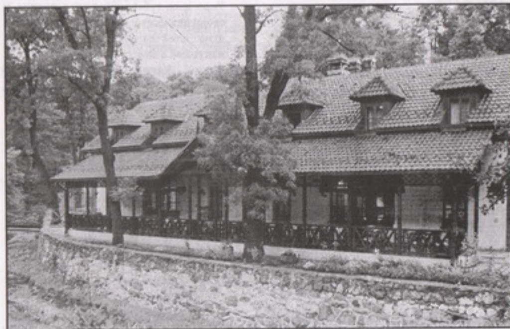
Хоћел „Српска круна“, снимљено 2005.

У тим променама, за обичне посматраче, има нешто тајанствено,