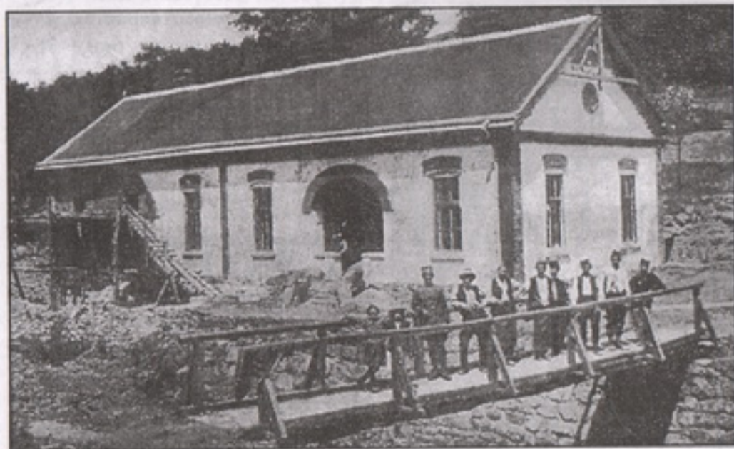
Зграда за сѐановање, снимљено 1932. Данас је на њом месту „Српска круна“

кара боље је организована медицинска служба. У циљу остварења додатног дохотка започето је флаширање бањске воде и узгајање печурака за продају.