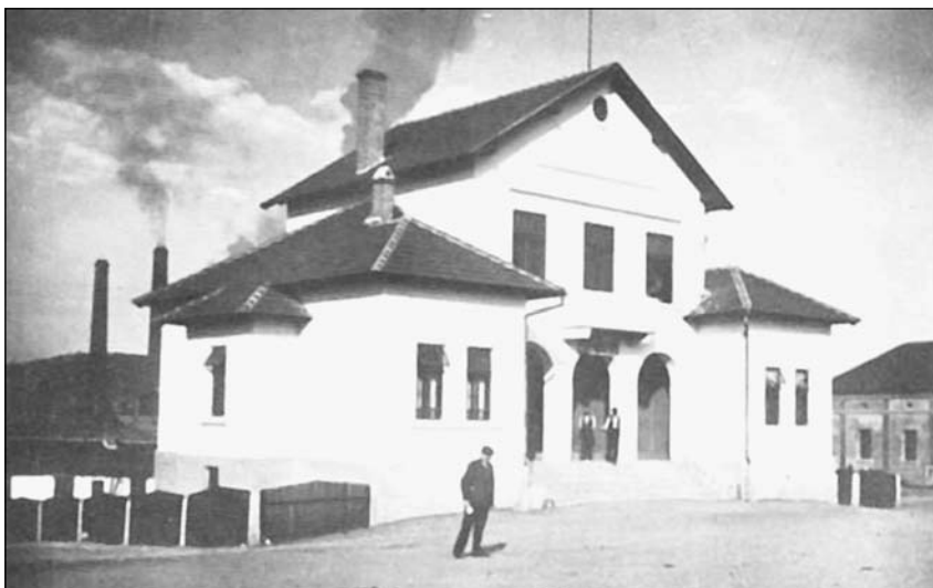
Стара француска зграда