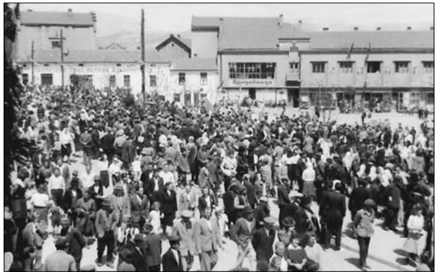
Бор средином 20. века

ни, као и у другим бољим кафанама, увече су госте забављали музичари са певачицом.