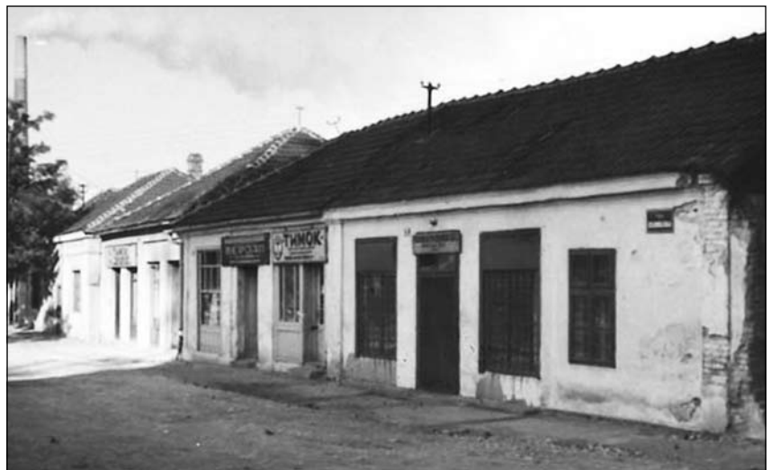
Сџари Три ослобођења