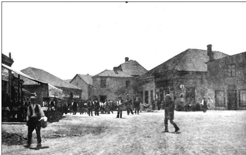
Стара Нишка улица

Полазећи од железничке „рампе“, одмах са леве стране Нишке улице, налази се једна стрма улица. Ова улица иде поред топионичке капије, а завршава се код капије флотације (ова се улица после ослобођења једно време звала Улица 9. бригаде, а једно време Козарска улица). Са леве стране ове улице, па до њеног краја, налазе се индустријски објекти Француског друштва Борских рудника (у даљем тексту: ФДБР). (Ови објекти, тј. сâм круг