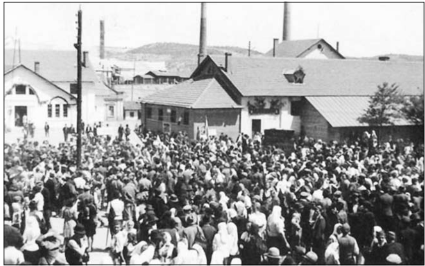
Пијачни дан у Бору средином 20. века

Поново кренимо од железничке рампе, левом страном Нишке улице. Прва зграда са ове стране је борска пошта. У приземљу су шалтери иза