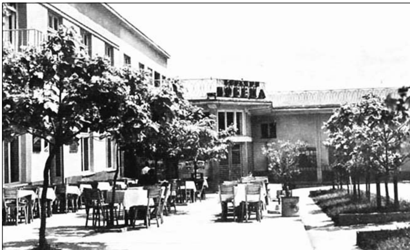
Хоћел „Београд“ и биоској „Победа“ данас имају сасвим друђачију намену

ви и др. То су најчешће биле породице борских трговаца, пиљара, кафеџија, пекара и осталих занатлија и општинских чиновника. У овом крају вароши налазила се и једна већа кућа, веома лепа. Била је то кућа неког грађевинског предузимача (након ослобођења, овде је био смештен Завод за запошљавање радника).