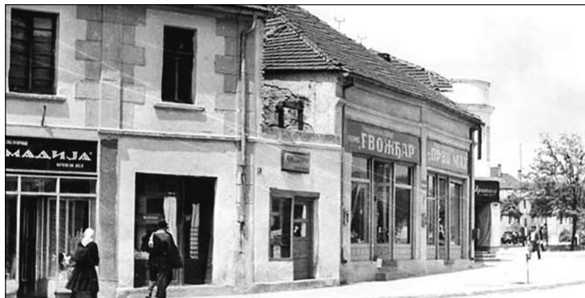
Бор средином 20. века

(У следећем броју Бележнице – Нова колонија)